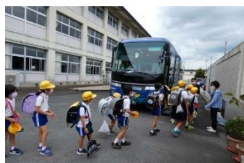
スクールバス下校

新型コロナは学校や家庭での生活や学び、街や社会までも変化させてしまいました。（このことを『ニューノーマル（新たな日常）』と呼んでいるようです。）思えば例年なら、子どもたちは40日余りの夏休みを謳歌します。でも、今年は「いつもと違った夏」。けれど、みんなはこの逆境をはねのけての経験から、大きく成長を遂げていると信じています。2学期以降、自然学校・体育祭など座学では学べない経験を積むこととなります。子どもたちのよいところを見つけ、褒め励ましてあげてください。