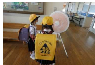
登校の暑気を取る大型扇風機

「夏休みゼロ宣言」小野市は子どもたちの「学びの保障」を前面に打ち出しました。エアコン追加配備、スポットクーラーや大型扇風機の設置、経口補水液や非接触型体温計、消毒液などの追加整備。炎天下での通学を支援するスクールバスの運行や学習支援スタッフの増員。さらに、「夏時程」期間の給食費無料。どれもこれも子どもたちの学びを止めないためのものです。